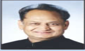
अशोक गहलोत मुख्यमंत्री, राजस्थान